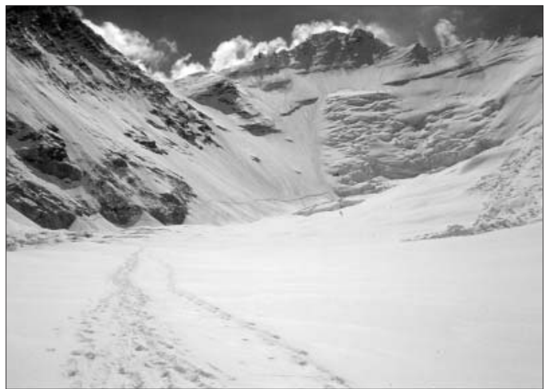
Fastizis frestgs en la «Val dal silenzi». En il fons dal tut il Lhotse cun sia flanca privlusa vers sid.