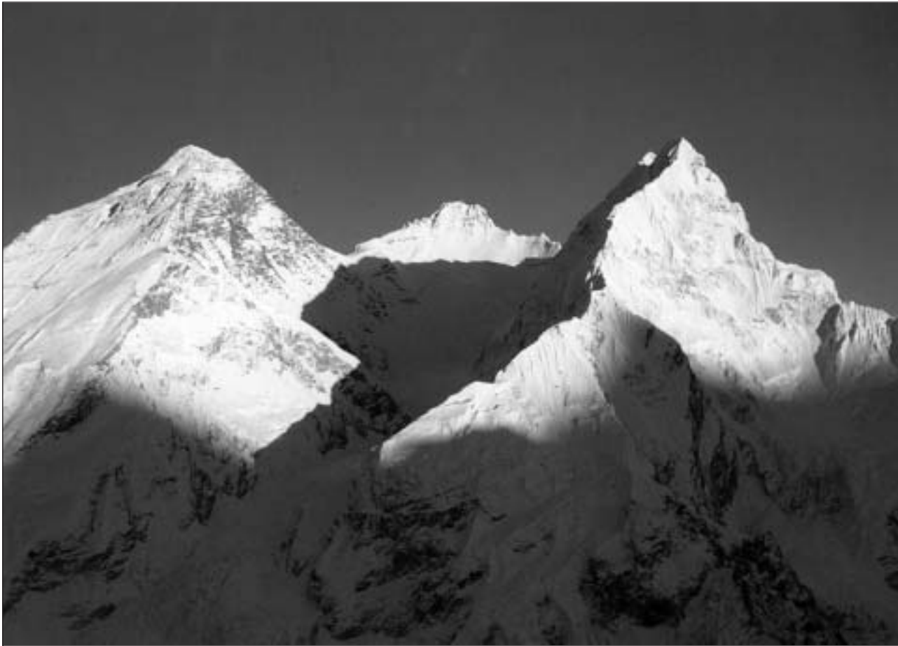
Vista totala dal Mount Everest (san.), Lhotse (mez) e Nuptse. Giudem sanester en il maletg en l'umbriva dal Nuptse l'enorm glatscher Khumbu cun la renomada ruptura dal glatsch.