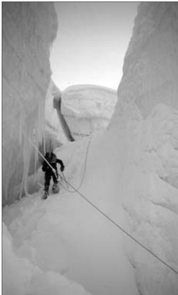
In Alpinist sa chatta en la ruptura dal glatsch amez immens blocs da glatsch.