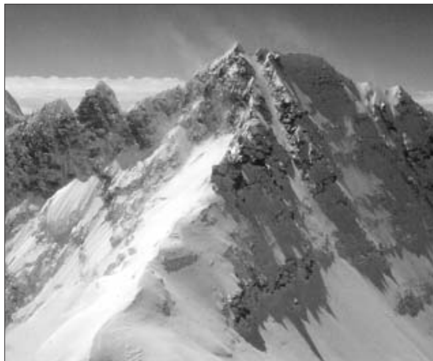
Structura dal Lhotse. Bain vesaveil è dretg en il massiv il renumà couloir dal Lhotse, cuvert cun naiv, stretg, taiss. (Angel da 60 grads, ca. 500 meters aut.)