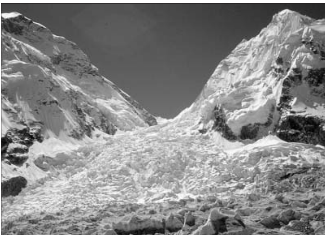
Ruptura dal glatsch vesi nà dal champ da basa cun il massiv da l'Everest (san.) e quel dal Nuptse (dretg).

Per ils participants da l'expediziun cumenza ussa la pli impurtanta fasa d'acclimatisaziun. Els ascendan divers culms modests, tranter auter numerus tschintgmillers senza num. Ils 7 d'avrigl s'installescha la squadra tenor program en il champ da basa. Quel è situà sin 5450 meters, en la proxima vischinanza d'ina morena laterala dal glatscher dal Khumbu. Sur il champ sa chatta ina imposanta ruptura dal glatsch, nua ch'il glatscher sa fultscha tras il stretg vau tranter la spatla dal Nuptse e da l'Everest. La vita en quest'autozza, sin glatsch e gleira, cun midadas da l'aura extremas – mintgant naivi ed entaifer paucas minutas datti sulegl e la regiun deserta sa stguda fin a 60 °C – prenda dals umans, che ristgan da vegnir fin si là, in'enorma autocontrolla e disciplina. Malsognas, mals d'autozza, flaivezzas psichicas, e betg il davos era sentiments d'encreschadetgna, surpandan era ils alpinists versads.